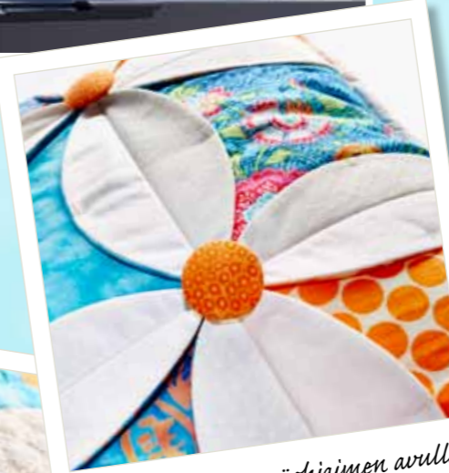
3D-kukkia ympyräohjaimen avulla (lisätarvike). Suosikki!