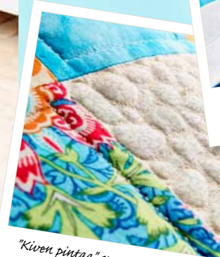
"Kiven pintaa" vapaaompelulla ja applikointi - kiva yhdistelmä!

Kohdistaminen ja napinläpien ompeleminen saattaa joskus tuntua haastavalta, mutta ei SAPPHIRE™ -ompelukoneella! Täysin tasaiset napinlävet syntyvät, kun napinläpien pylväät ommellaan samaan suuntaan, joten niistä tulee täysin tasapainoiset joka kerta. Valittavana on useita erilaisia napinläpiä.